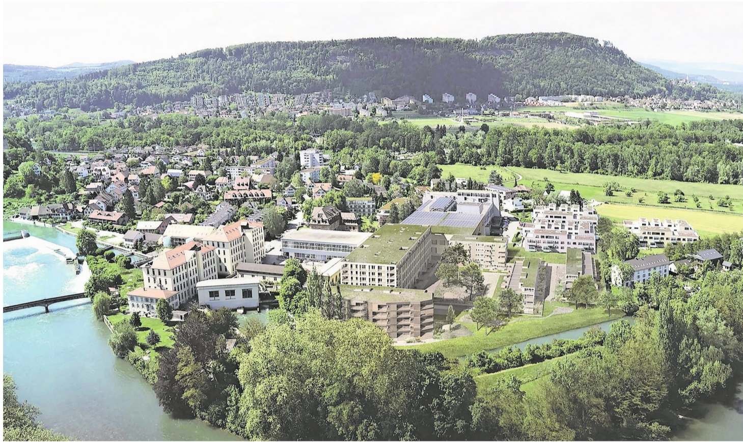
Aus dem ehemaligen Fabrikareal der Spinnerei in Unterwindisch ist an der Reuss ein begehrtes Wohnquartier entstanden.

«Die Gemeinde Windisch und Oberburg hat in ihrer heutigen Versammlung mit besonderem Wohlgefallen vernommen, dass Sie in ihrem Gebiete eine Spinnmaschine zu erbauen und das dazu dienliche Lokal zu erhandeln wünschen.» Unterzeichnet ist der Brief von Ge-