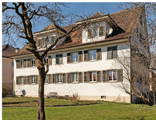
Im Estrich dieses Hauses in der Gusch richteten Vater und Sohn Kunz 1811 eine handbetriebene Spinnerei ein.