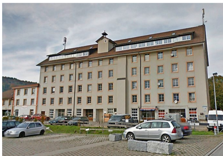
Der Fabrikbau der ehemaligen Spinnerei Kunz in Rorbas steht noch heute.