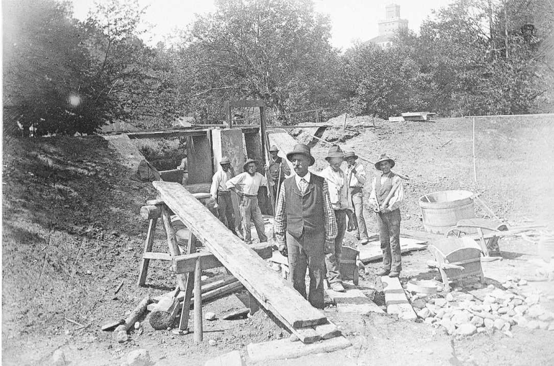
Bauarbeiten für ein Staubecken gegen Ende des 19. Jahrhunderts in Uster.