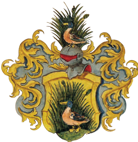
Familienwappen der Familie Heinrich Moser. Älteste Abbildung einer der am häufigsten verwendeten Varianten des Moser-Wappens, 1728.