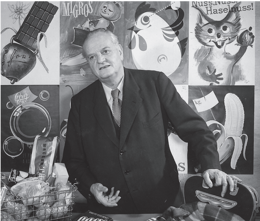
Gottlieb Duttweiler (1888–1962)