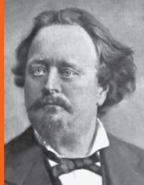
Georg Wander 1841 – 1897